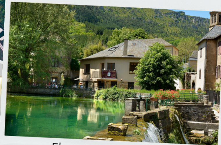
Florac - trois rivières