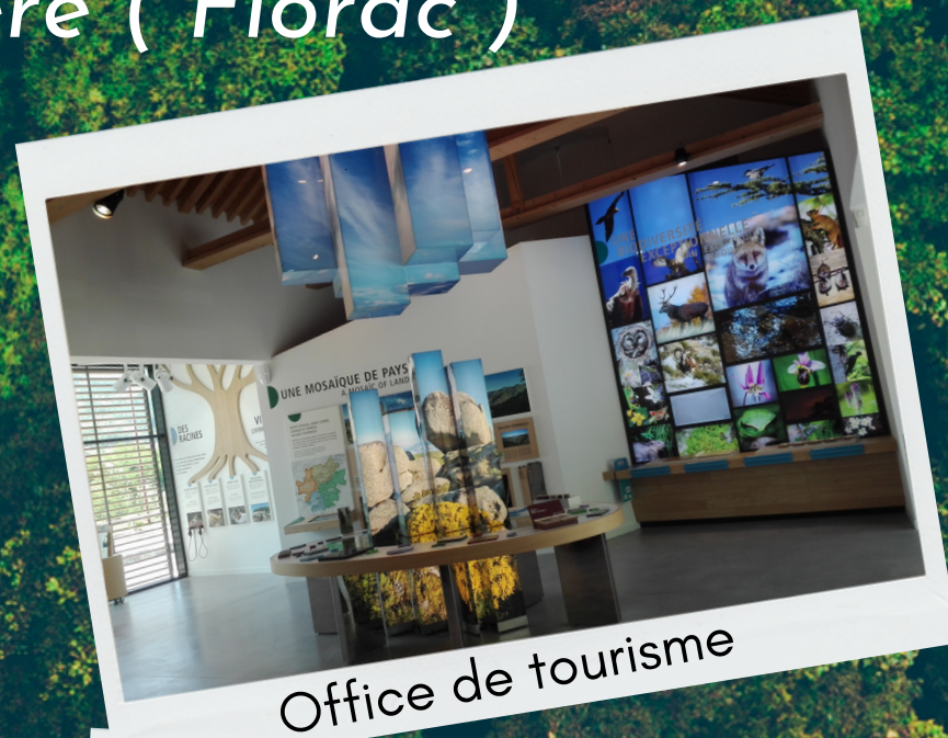
Office de tourisme

A Maison du Tourisme et du Parc national des Cévennes vous trouverez des informations touristiques sur la destination Gorges du Tarn, Causses & Cévennes, un lieu agréable qui vous invite à une pause détente et à la découverte du Parc national des Cévennes par sa scénographie et sa boutique.